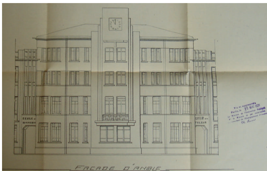
Plan de l'école Anatole France, 1931

Cet atelier invite à découvrir l'école d'autrefois à travers les archives. Les documents révèlent de nombreuses informations qui nous permettent de découvrir l'histoire des écoles à Villeurbanne. De quand date votre école ? Plans, photographies, registres d'appel et cartes postales permettront aux élèves de se rendre compte des différences et des points communs entre l'école d'hier et d'aujourd'hui.