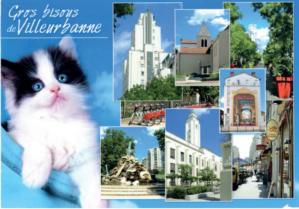
carte postale non datée