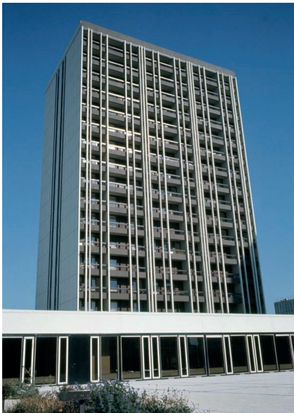
Barre d'habitations, quartier de la Perralière, non datée

Votre école se situe à la Perralière ? Vous souhaitez travailler avec votre classe sur les patrimoines de votre quartier ? N'hésitez pas à nous contacter pour imaginer ensemble un projet.