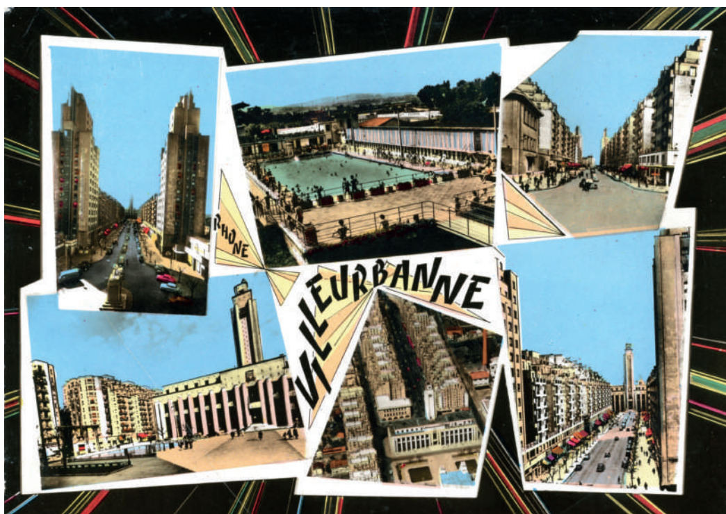
Carte postale, non datée

Comment, au fil du temps, Villeurbanne a-t-elle évolué depuis le XIX e siècle ? De la campagne à la ville, Villeurbanne s'est transformée en profondeur. À partir de documents historiques, plans cadastraux, cartes et photographies les élèves peuvent observer et se questionner sur l'évolution de leur ville de 1800 à nos jours.