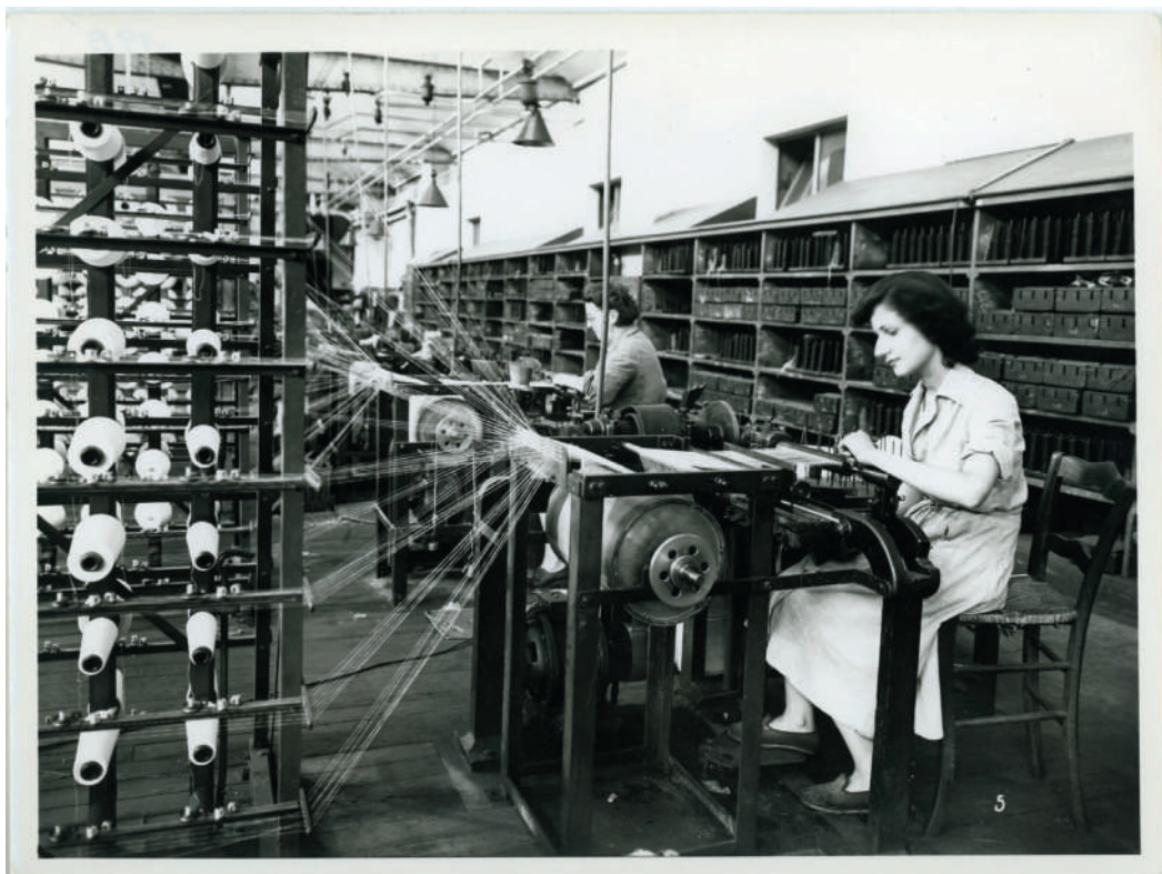
Deux ouvrières sur métiers à tisser - Usine Dognin, 1954

* Dossier pédagogique disponible à partir de novembre 2022 sur le site du Rize et dans votre école.