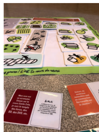
Capsule Villeurbanne à hauteur d'enfants , 2022