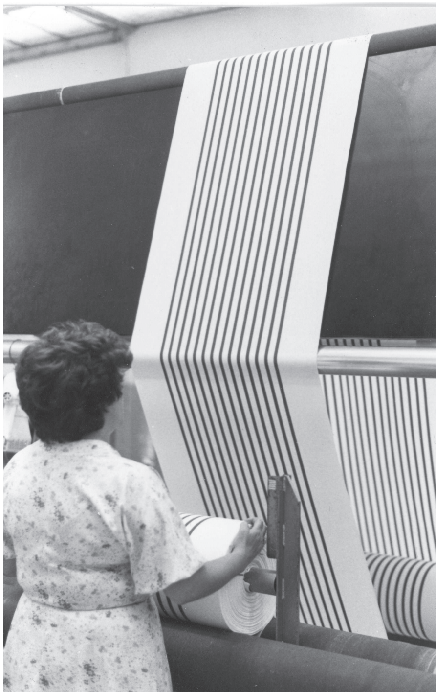
Ouvrière avec machine, non datée, Usine Billon, © Archives municipales de Villeurbanne

* Dossier pédagogique disponible à partir de novembre 2022.