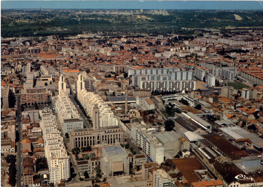
Photo aérienne des Gratte-ciel, 1985