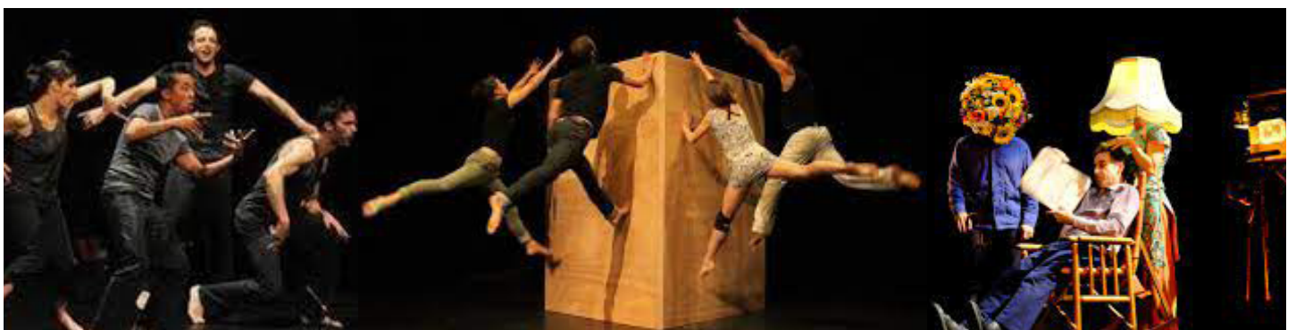
Echoa - 2001