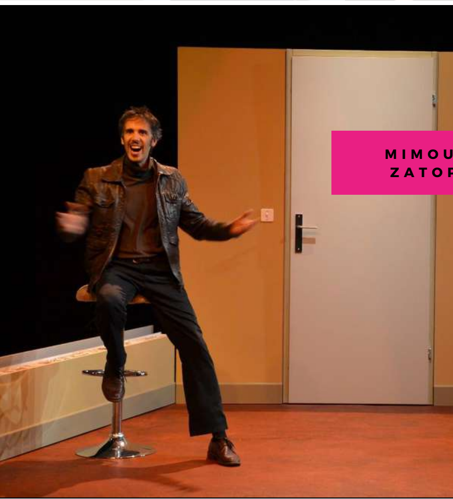
MIMOUN & ZATPEK