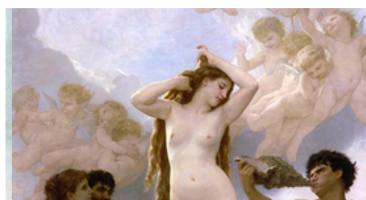
Naissance de Venus, BOUGUEREAU, Musée d'Orsay