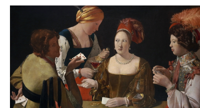
Le tricheur à l'as de carreau, Georges LA TOUR, Musée du Louvre